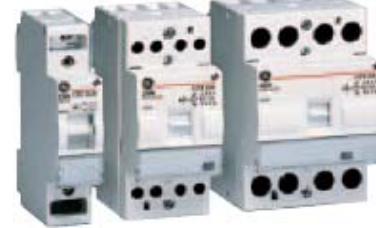
Sklopnici dnevno-noćni: 2NO, 3NO - 666164, 4NO - 666164, 666165, 666168

... za isključivanje rasvete, opreme za grejanje, motora za pumpe i ventilatore; mogu se koristiti kao dnevni i noćni sklopnici; osim 20A svi imaju DC zavojnice što im daje potpuno bešuman rad; sadrže unutrašnji diodni ispravljač-mogu raditi pod DC i AC izvorom energije