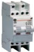
666470, 666477, 666484

... za upravljanje napajanja malih tereta niskog napona; isključivanje rasvete, grejanje itd.; omogućeno ručno upravljanje