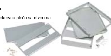
pokrovna ploča modularna

Montažna ploča, pocinkovani čelični lim 2mm