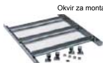
Okvir za montažu