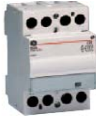
666142 i 666148